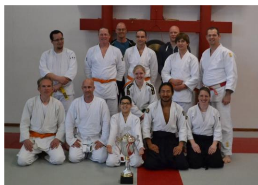
De Aikido groep op de Embukai 2014

De Aikidostijl die in Voorschoten wordt beoefend, het Yoseikan Aikido, is via de Sectie Yoseikan Aikido aangesloten bij de landelijke bond Aikido Nederland. De Sectie organiseert onder andere maandelijks centrale trainingen en een jaarlijkse demonstratie dag, de Embukai. Alle aangesloten scholen geven een demonstratie met allemaal hetzelfde thema. Dit jaar is het thema ontwapeningstechnieken met mes en zwaard. De mooiste demonstratie wint een wisseltrofee. Vorig jaar heeft de Aikidogroep van Budocentrum Junansei gewonnen, dus dit jaar zijn wij de titelverdedigers! Zowel de senioren en de jeugdgroep hebben een demonstratie voorbereid.