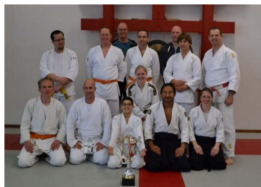
De Aikido groep op de Embukai 2014

De Aikidostijl die in Voorschoten wordt beoefend, het Yoseikan Aikido, is via de Sectie Yoseikan Aikido aangesloten bij de landelijke bond Aikido Nederland. De Sectie organiseert onder andere maandelijks centrale trainingen en een jaarlijkse demonstratie dag, de Embukai. Alle aangesloten scholen geven een demonstratie met allemaal hetzelfde thema. Dit jaar is het thema ontwapeningstechnieken met mes en zwaard. De mooiste demonstratie wint een wisseltrofee. Vorig jaar heeft de Aikidogroep van Budocentrum Junansei gewonnen, dus dit jaar zijn wij de titelverdedigers! Zowel de senioren en de jeugdgroep hebben een demonstratie voorbereid.