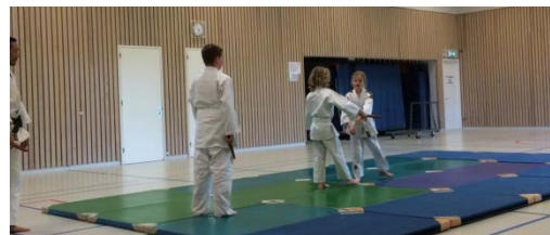
De Aikido jeugd oefent voor de Embukai

Iedere vrijdagmiddag van 17:00-18:00 kan er bij Budocentrum Junansei Jeugd Aikido getraind worden in de Frans de Vette zaal. Hoewel de groep pas in januari van start is gegaan, wordt er hard geoefend om deel te kunnen nemen aan de landelijke demonstratiedag (Embukai) op zondag 12 april.